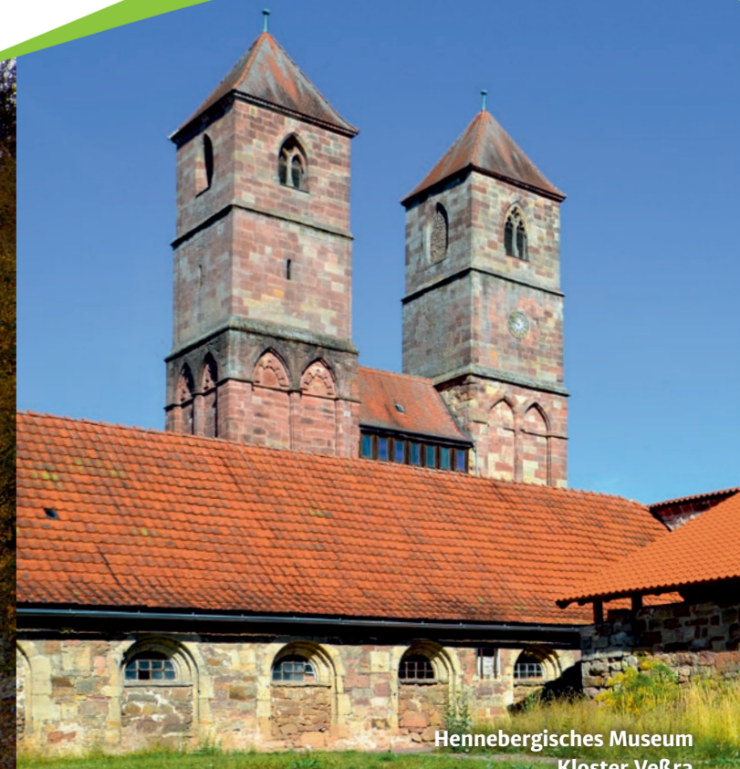
Hennebergisches Museum Kloster Veßra