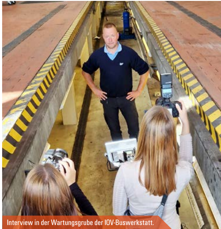
Interview in der Wartungsgrube der IOV-Buswerkstatt.