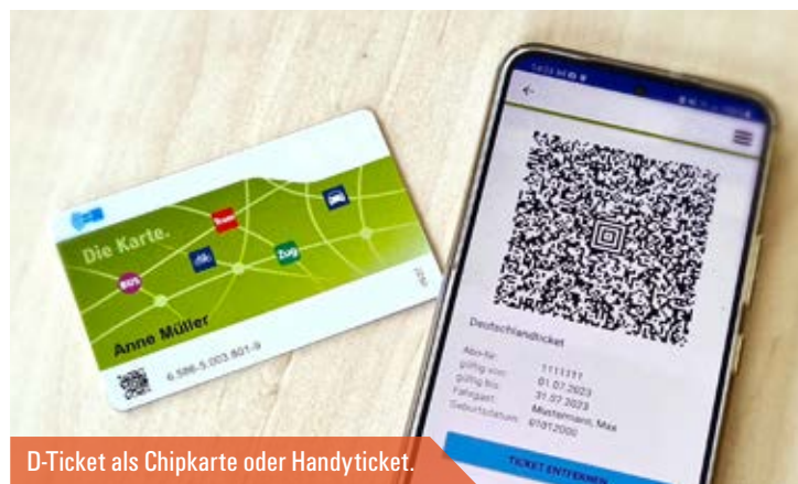
D-Ticket als Chipkarte oder Handyticket.

Jobticket-Inhaber mit D-Ticket erhalten den ab 1. Januar 2024 gültigen digitalen Fahrschein als Chipkarte über ihr Unternehmen, das mit der IOV den Vertrag abgeschlossen hat. Das wird bis zum