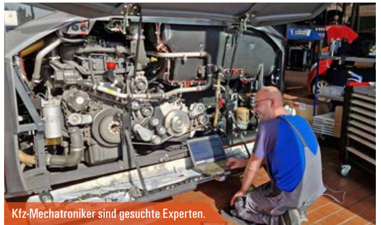
Kfz-Mechatroniker sind gesuchte Experten.

» Verkehrsunternehmen freuen sich über jede Bewerbung. «