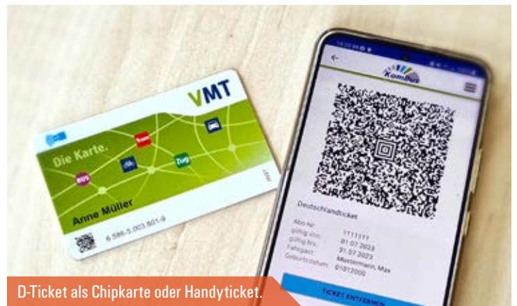
D-Ticket als Chipkarte oder Handyticket.

und kann bis zum Zehnten des Monats für den Folgemonat gekündigt werden.