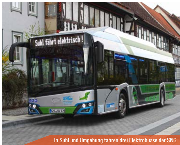
In Suhl und Umgebung fahren drei Elektrobusse der SNG.

Die drei Elektrobusse der SNG Suhl/Zella-Mehlis sind jeweils bis zu 7.000 Kilometer im Monat in