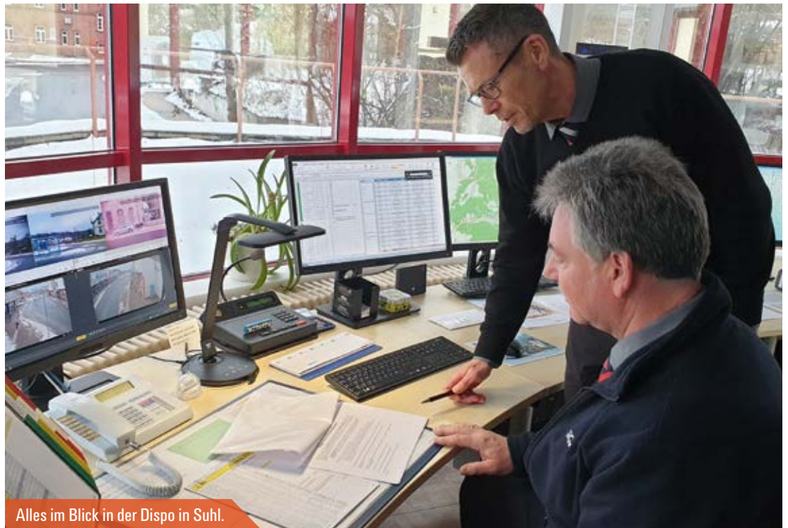
Alles im Blick in der Dispo in Suhl.

Das sind die Extreme in diesem Job: Mal läuft alles wie am Schnürchen. Dann klingeln mehrere Telefone gleichzeitig. Ein panischer Fahrgast hat seine Geldbörse vermutlich im Bus verloren. Ein Busfahrer meldet einen leichten Unfall mit Blechschaden. Im Winter und bei widrigen Straßenverhältnissen verspäten sich Busse. Die elektronischen Fahrgastinformationssysteme müssen das in Echtzeit an Haltestellen und auf