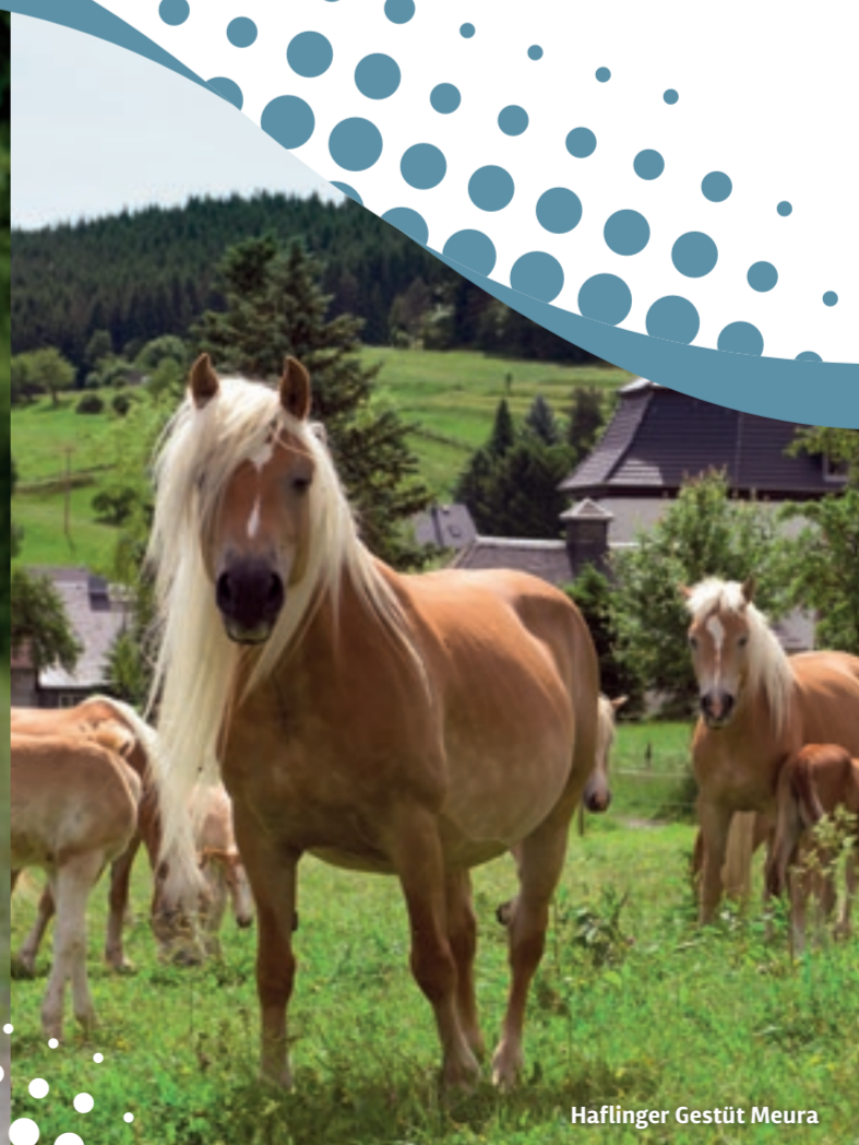
Häflinger Gestüt Meura